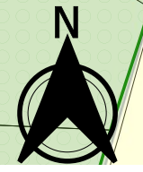
Planche "centrée" 1:5 000